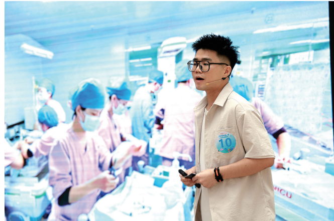
选手在分享光影作品背后的故事。

珠江商报讯 记者吴小镛 通讯员李述言报道:用镜头定格真情,用摄影捕捉感动。5月30日下午,南方医科大学顺德医院门诊大堂里光影交汇,真情流动,该院2024年“定格最美‘医’瞬”光影故事会决赛在此举行,10名决赛选手通过10组光影作品,带领现场人员一起走进镜头下的医学世界,聆听照片背后的故事,触摸医学的温度,感受生命的力量,领略医者的敬业奉献之美。