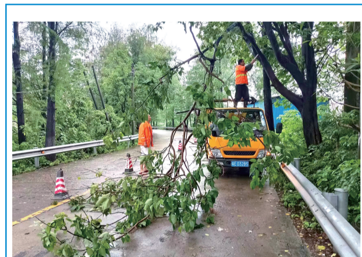
工作人员清理折断的树枝。