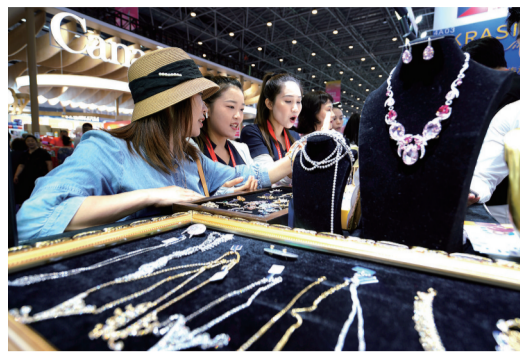
参观者在消博会上选购珠宝首饰。