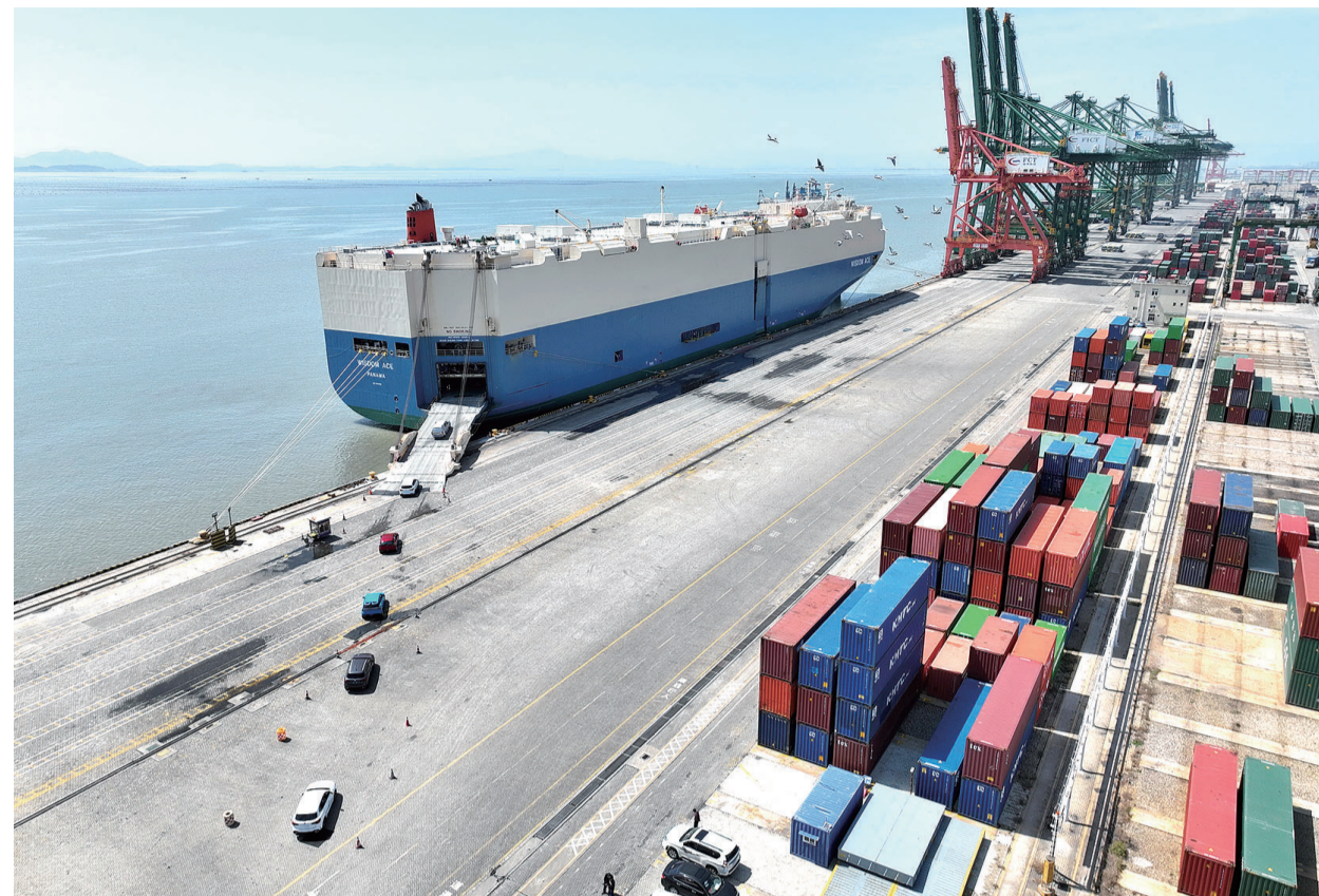
准备出口的车辆从福州港江阴港区码头驶上远洋滚装轮。

起步平稳。从四大宏观指标来看，GDP比上年四季度环比增长1.6%；城镇调查失业率平均值为5.2%，比去年同期下降0.3个百分点；全国居民消费价格指数（CPI）同比持平，扣除食品和能源