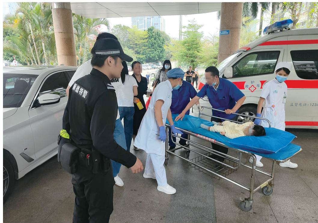
民警和家属配合医护人员,将小孩送往救治室。

珠江商报讯 记者谢意通讯员陈秋沅 徐小瑜摄影报道:近日,顺德区陈村镇上演了暖心一幕,一名孩子因突发高烧惊厥,家属焦急向路面巡逻警力求助,在复杂路况下,民警用警车开道,一路鸣笛疾驰,为求助车辆开辟“绿色通道”,不到10分钟便将孩子送到医院。