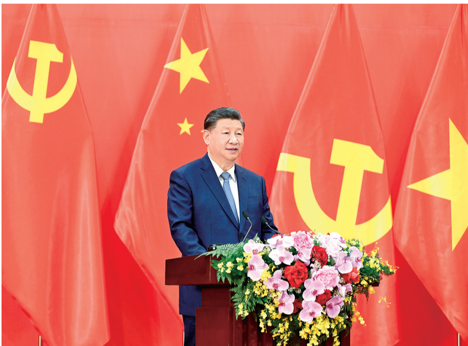
习近平发表题为《赓续传统友谊,开创中越命运共同体建设新征程》的重要讲话。