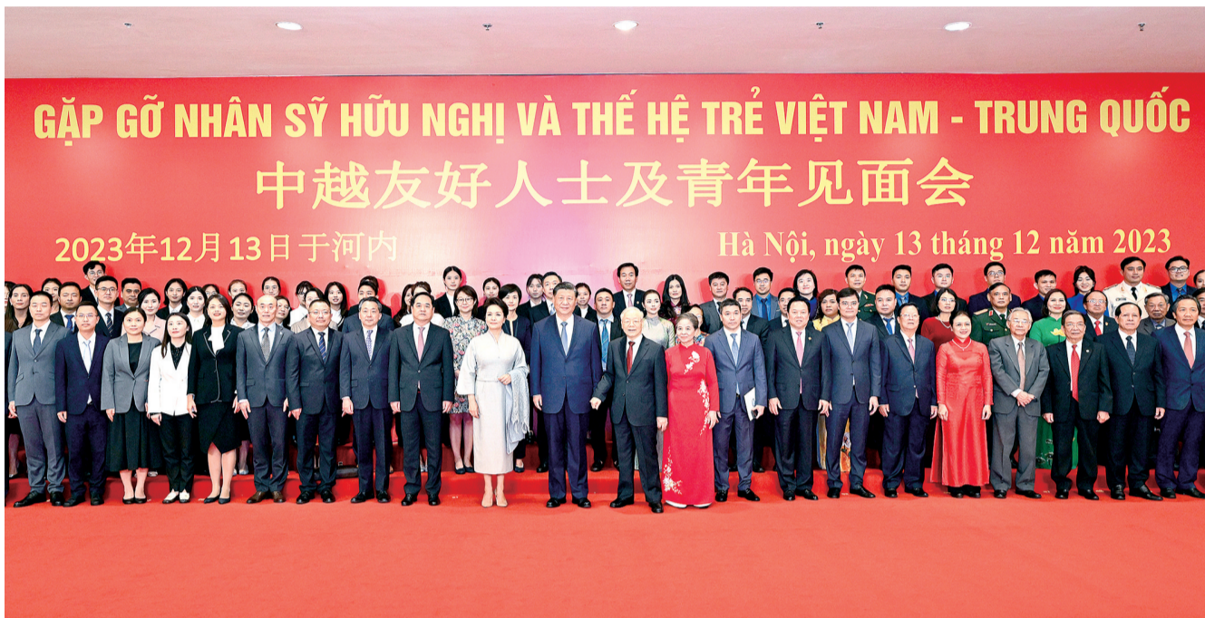
习近平夫妇和阮富仲夫妇同中越两国青年和友好人士代表亲切合影。

新华社河内12月13日电 当地时间12月13日下午,中共中央总书记、国家主席习近平和夫人彭丽媛在河内同越共中央总书记阮富仲夫妇共同会见中越两国青年和友好人士代表。