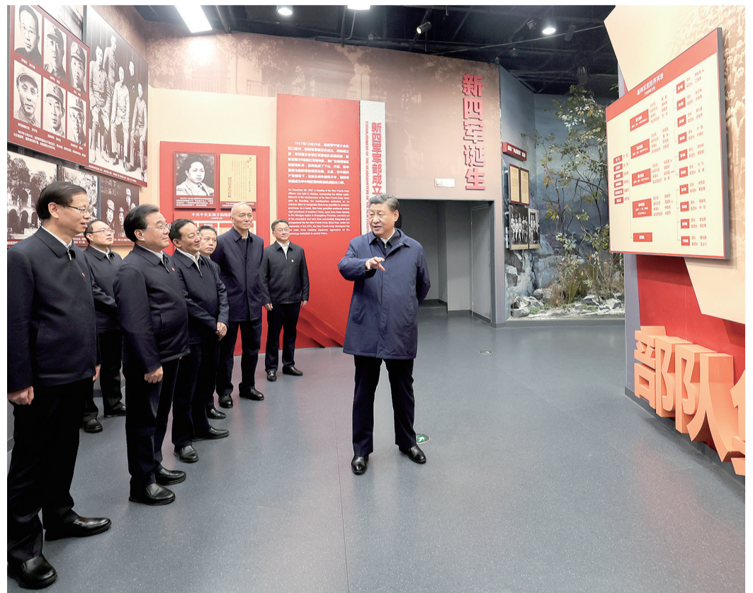
12月3日,中共中央总书记、国家主席、中央军委主席习近平在上海考察结束返京途中,来到江苏省盐城市参观新四军纪念馆。

新华社上海/江苏盐城12月3日电 中共中央总书记、国家主席、中央军委主席习近平近日在上海考察时强调,上海要完整、准确、全面贯彻新发展理念,围绕推动高质量发展、构建新发展格局,聚焦建设国际经济中心、金融中心、贸易中心、航运中心、科技创新中心的重要使命,以科技创新为引领,以改革开放为动力,以国家重大战略为牵引,以城市治理现代化为保障,勇于开拓、积极作为,加快建成具有世界影响力的社会主义现代化国际大都市,在推进中国式现代化中充分发挥龙头带动和示范引领作用。