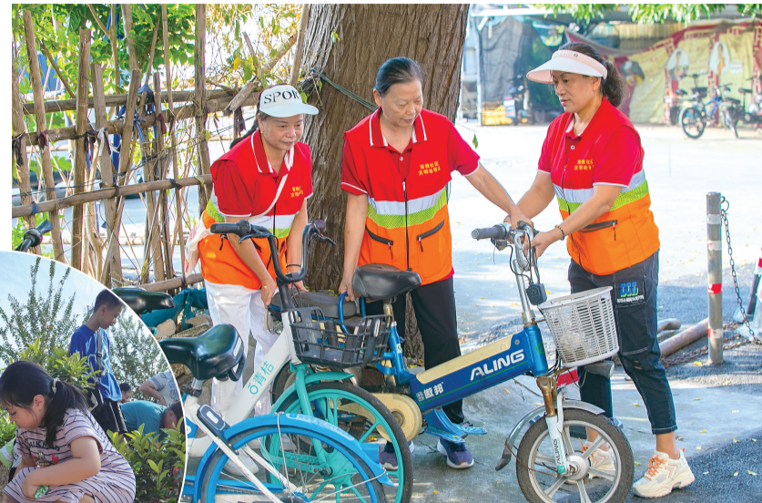
▲伦敦街常教社区文明劝导队常态化开展志愿服务。

共建共享和美家园。在过往的项目资助中,通过支持村居培育社区自组织、搭建议事协商平台、开展喜闻乐见的文化活动,为一批村居推动共建共治塑强了“软实力”。今年以来,该领域项目申报数量接近申报总量的一半,侧面反映了村居建设和和美家园的巨大热情。