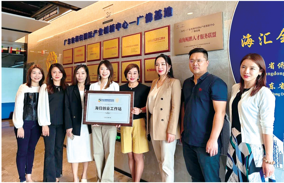
工作站将做好政策解读、创新创业、就业对接和联谊交友等服务。

珠江商报讯 记者洗颖仪报道:10月24日下午,广佛海归交流会暨顺德留协“海归创业工作站”授牌仪式举行。站点将通过做好政策解读、创新创业、就业对接和联谊交友等服务,为海归人才打造更广阔的创新创业服务平台,为促进集聚海归青年力量添砖加瓦。 在广东省侨界海归协会、佛山市顺德区留学生协会、佛山市留才协会、南海区青商会四个协会代表的见证下,佛山市顺德区留学生协会“海归创业工作站”授牌落户广东省海归国际产业创新中心广佛基地。授牌仪式后,在广东省侨界海归协会的组下,四个协会的代表及成员组成交流团,参观了广东省侨界海归协会的会员企业。 随后,交流团一行人来到了