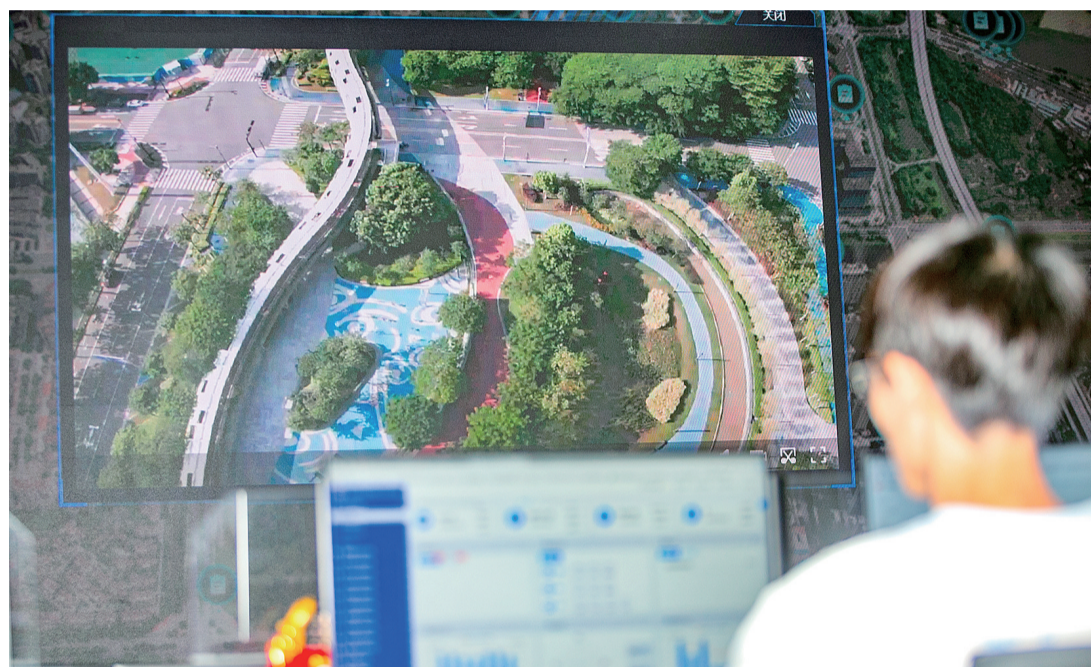
智能设备实时拍摄环境状况,以便后方调度员根据环境卫生情况进行工单派发,快速处理。

机和扫地车,大良“物业城市”项目部还投入了垃圾满溢检测器、无人巡逻车、高压清洗车等智能化设备,借助先进的技术手段和管理方法,对辖区范围内的环境卫生进行智能化管理,不仅提高了人员、车辆、垃圾分类的精细化程度和管理效率,也提升了城市环境质量和风貌品质。