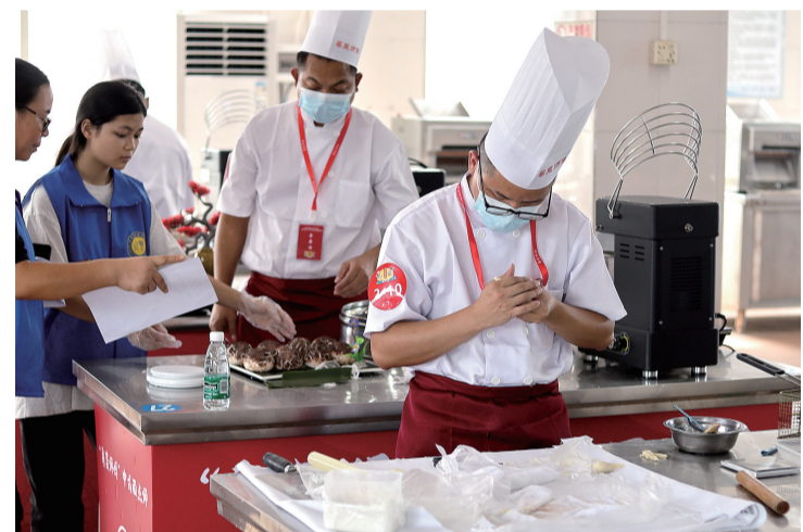
选手进行专业技能考核。

珠江商报讯 记者陈敏奇报道:10月25日,2023年顺德区职工职业技能大赛“粤菜师傅”中式面点师技能比赛在顺德区永丰职业培训学校举行。比赛当天,来自区内优秀餐饮企业和专业院校的30位中式面点师同台竞技,展示顺德“粤菜师傅”高超的职业技能水平。