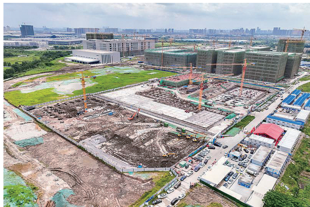
今年6月,埃斯顿-克鲁斯机器人华南研发生产基地项目正式开工建设。/资料图

当前,三龙湾科技城正聚力打造“1+1+N”科技创新格局,助力全市新一轮高质量发展。“1+1+N”科技创新格局中,“1”是指“科技研发与成果转化基地”,主要位于南海三山新城以及顺德陈村镇;另一个“1”是指“佛山新城国际