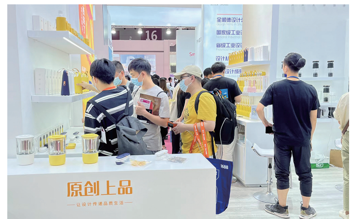
参展期间,原创上品的产品以创新型设计受到众多采购商关注。