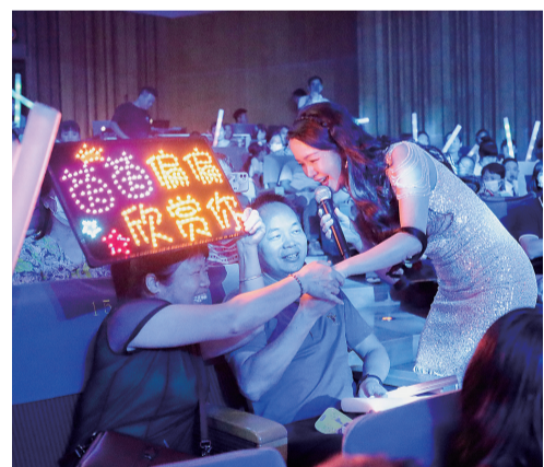
图为演出现场。

珠江商报讯 记者李芸报道：6月3日晚，“顺德从艺者圆梦行动”之“我们的天空——顺德音乐原创作品诗歌朗诵音乐会”在顺德演艺中心音乐厅唱响，来自广佛深肇等地观众济济一堂，与演艺歌手们一起为这个盛夏讴歌起舞，为顺德喝彩，上演了一场富有顺德本土特色的原创作品盛宴。